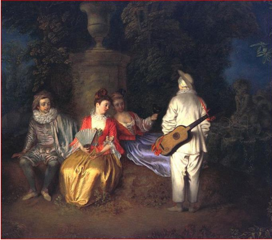
Antoine Watteau, La Partie Carrée