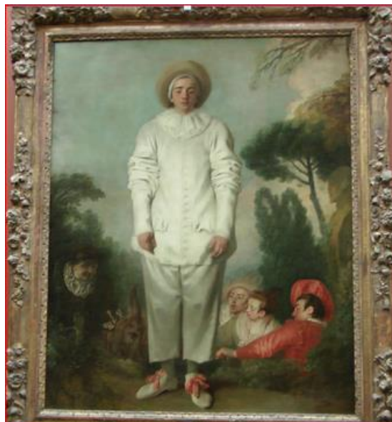
Antoine Watteau, Pierrot

Choisissez un tableau parmi les suivants d'Antoine de Watteau ou une affiche de Chéret, sans l'indiquer à vos camarades. Décrivez la scène représentée à partir de la position des personnages, leurs attitudes, leurs habits, le paysage, etc. Les camarades ont sous les yeux l'ensemble des images proposées, mais ils ignorent l'image que vous avez choisie. Gagnera la compétition le camarade qui devine le/la premier/ère le tableau décrit.