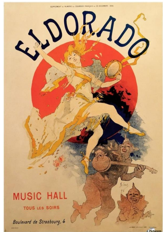
Jules Chéret, affiches