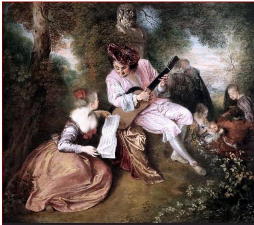
Antoine Watteau, L'échelle de l'amour