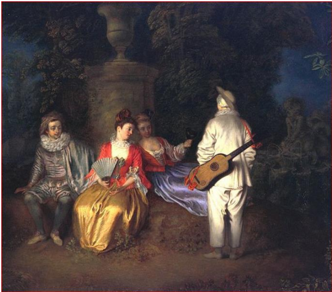
Antoine Watteau, La Partie Carrée