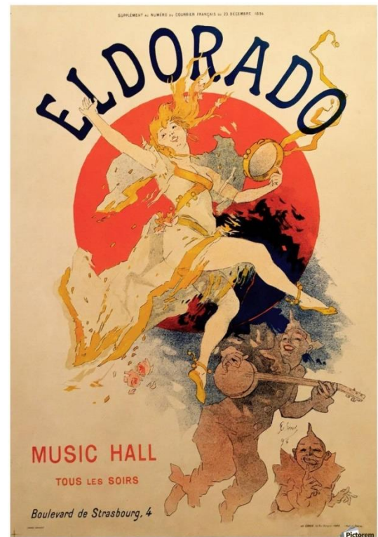
Jules Chéret, affiches