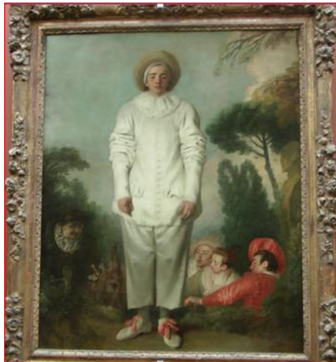
Antoine Watteau, Pierrot

Choisissez un tableau parmi les suivants d'Antoine de Watteau ou une affiche de Chéret, sans l'indiquer à vos camarades. Décrivez la scène représentée à partir de la position des personnages, leurs attitudes, leurs habits, le paysage, etc. Les camarades ont sous les yeux l'ensemble des images proposées, mais ils ignorent l'image que vous avez choisie. Gagnera la compétition le camarade qui devine le/la premier/ère le tableau décrit.